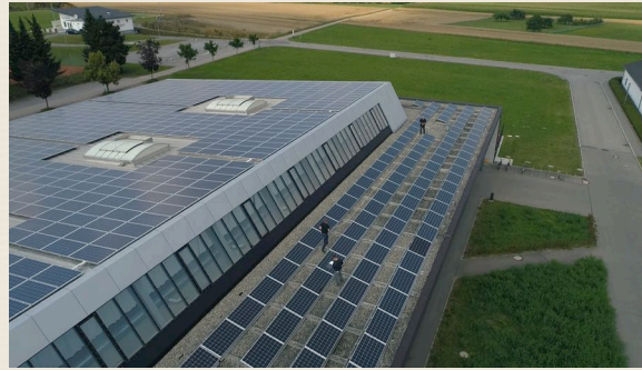
Werk 1 : die Bürger Energie Deißlingen eG prüft die Photovoltaik-Installation auf der Volksbanksporthalle.