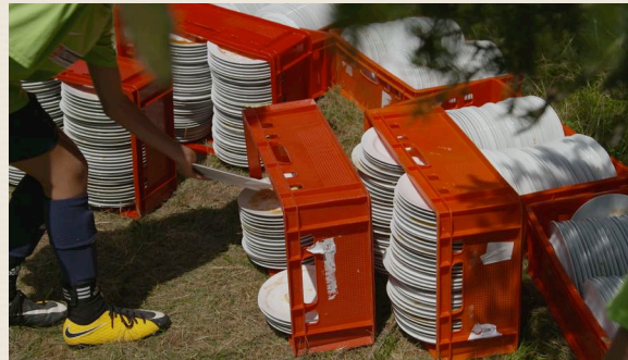
Fußballzeltlager auf dem Klippeneck, seit 1967 vom FSV Denkingen organisiert und seit über 30 Jahren vorbildlich nachhaltig. Kein Wegwerfgeschirr – es wird gespült !